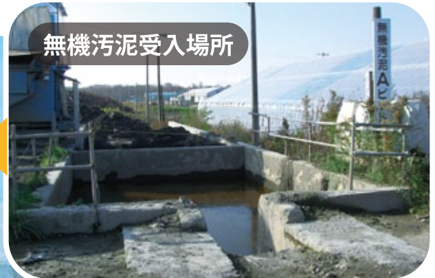
無機汚泥受入場所