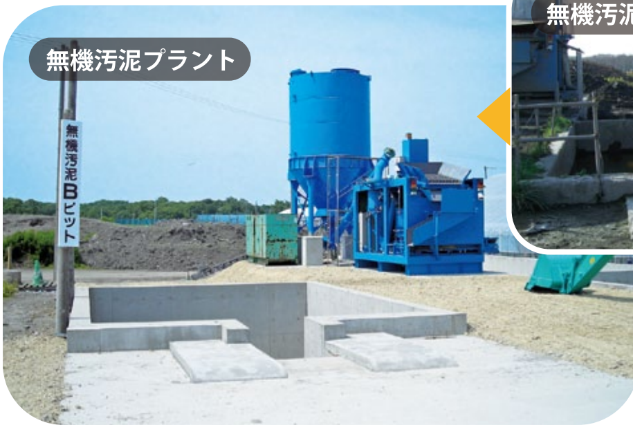
無機汚泥プラント